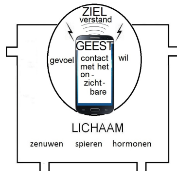
Fig 2. De mens, (schematisch weergegeven), bestaat uit ziel, geest en lichaam.

Voor de moderne jeugd kan begrijpelijk gemaakt worden dat de mens bestaat uit geest, ziel en lichaam door middel van een karikatuur. (Fig. 2).