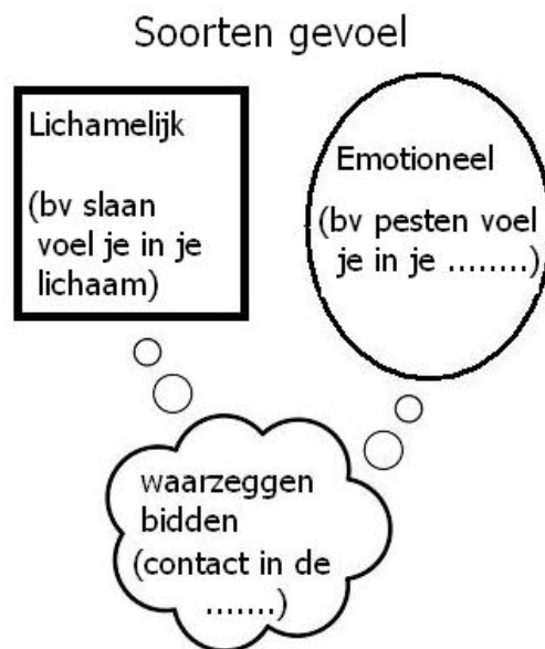
Fig. 1. De mens een complex wezen, met bijvoorbeeld verschillende soorten gevoel.

De mens heeft echter ook een niet-stoffelijke dimensie. Dat is te verduidelijken aan de hand van de verschillende soorten gevoel die een mens kan hebben. (Fig. 1)